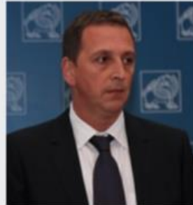
მიხეილ გიორგაძესთან დაკავშირებული კომპანიები